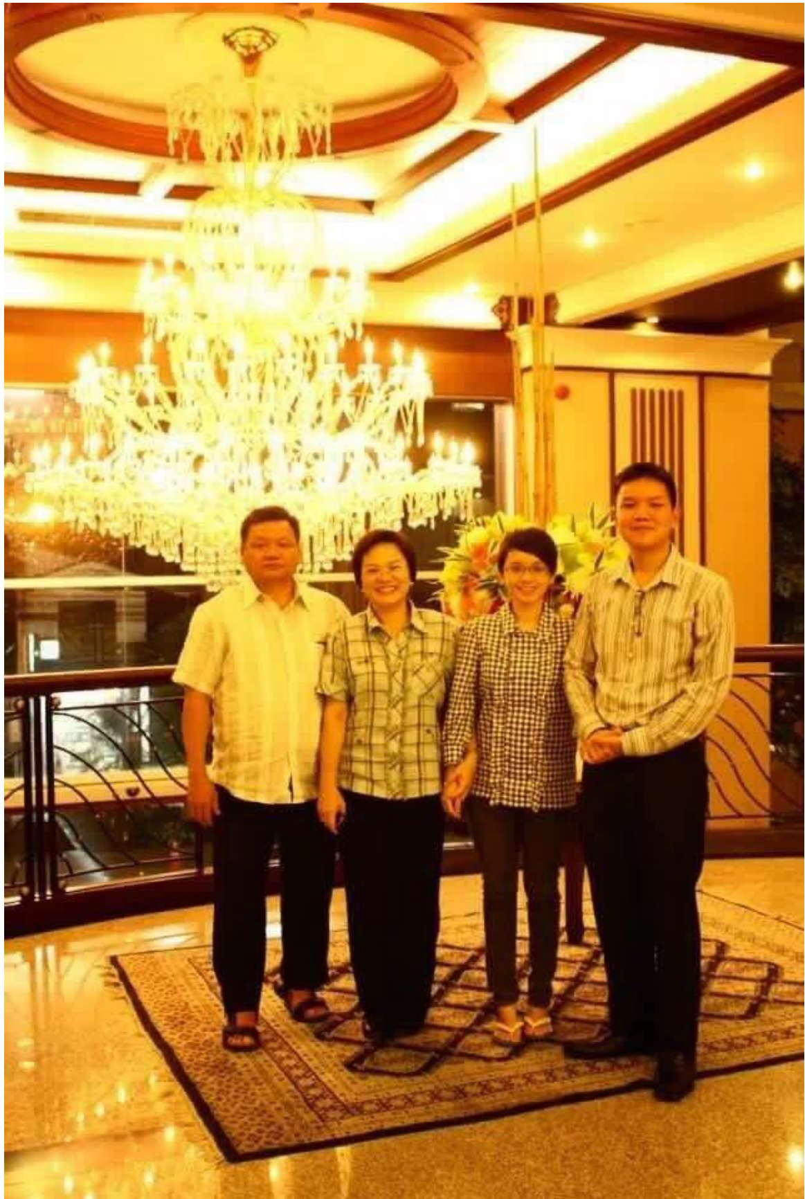
ครอบครัวสังข์ภิรมย์