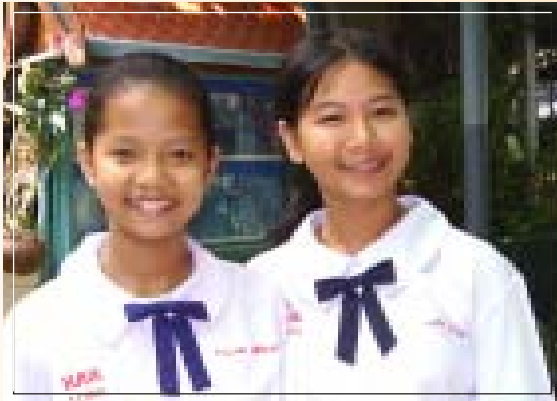
น้องเมฆากับน้องเมย์ คู่หูทำดี

ค้างแล้ว และอย่างหนูชอบเล่นเกมส์ เพื่อนก็จะเตือนตลอดว่าอย่าเพิ่งเล่นเกมส์นะ อะไรอย่างนี้