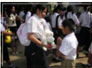
น้ำใจ เมล็ดพันธุ์ใหม่

ค่อยตรวจดูให้ดี ตั้งแต่เขาเตือน จากที่หนูได้ 9 คะแนน ก็ได้เต็ม 10