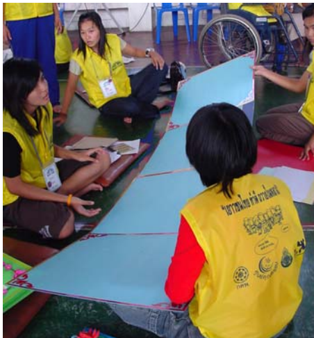
๑๖๒ เยาวชนไทย ทำดี ถวายในหลวง