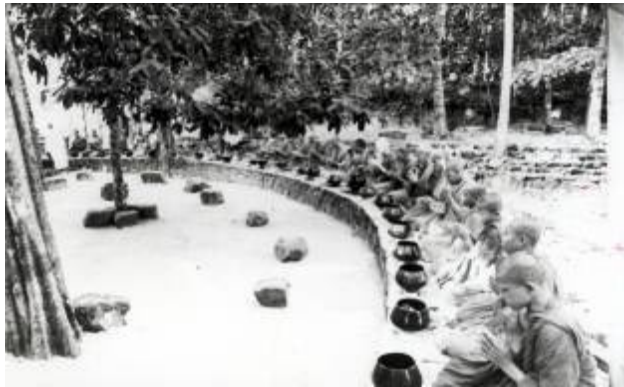
bw0363 ภาพถ่ายเดี่ยว

ลานหินโค้ง สร้างขึ้นเพื่อรองรับการเลียงพระในสมัยพุทธกาล ที่พระสงฆ์ฉันจังหันบนพื้นดิน ลานหินโค้งจึงเป็นจุดกำเนิด ประเพณีตักบาตรสาธิต “ความคิดเรื่องหินโค้งก็ค่อย ๆ เข้ามา จำไม่ได้แล้วว่าความคิดฟักตัวขึ้นอย่างไร แต่เราชอบโค้ง พระจันทร์ครึ่งซีก มันสวยกว่าเป็นศิลปะกว่าที่อื่น ๆ แล้วก็สะดวก ประธานสงฆ์นั่งตรงกลางสามารถเห็นองค์อื่น ๆ หมด”