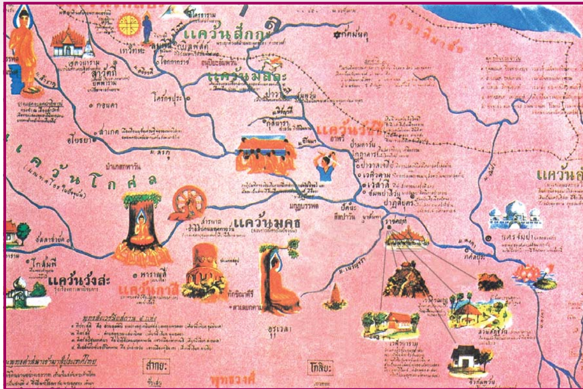
ที่มา : สูแดนพุทธองค์ อินเดีย-เนปาล โดย พระวิเทศโพธิคุณ (ว.ป.วีรยุทธโธ)