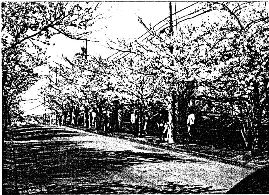
ถนนใหม่หมู่บ้าน ที่ตำบล ชากูระ: ตำบล รอกตอก บ้าน ชนรัง ก่อนที่ตัด มีบริเวณสวน