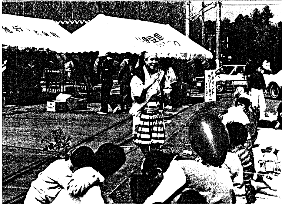
การเสด็จพร้อมเสด็จ ที่มีบรรณาการแม่เหล็ก ๑๐ ๑ ในงานเทศกาลดอกซากุระ :