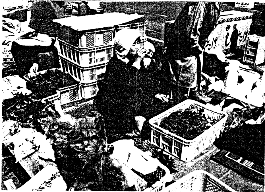
ชาวบ้านทำพืชผลสดมาจำหน่ายเพื่อ การ เพลิดเพลิน และ สวรรค์ ในงานเทศกาลดอก ซากุระ :