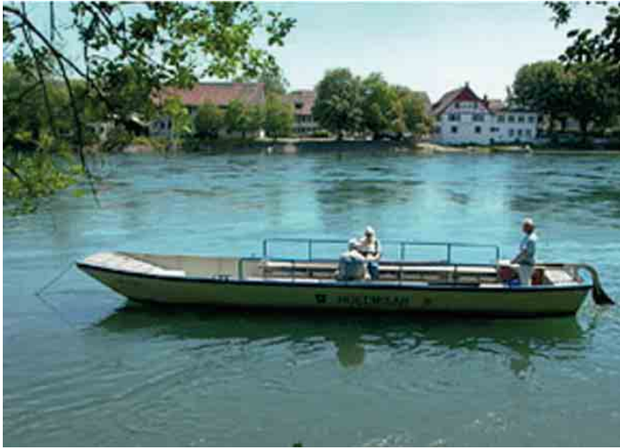
A ferry takes passengers from Ellikon across the Rhine, Zurich