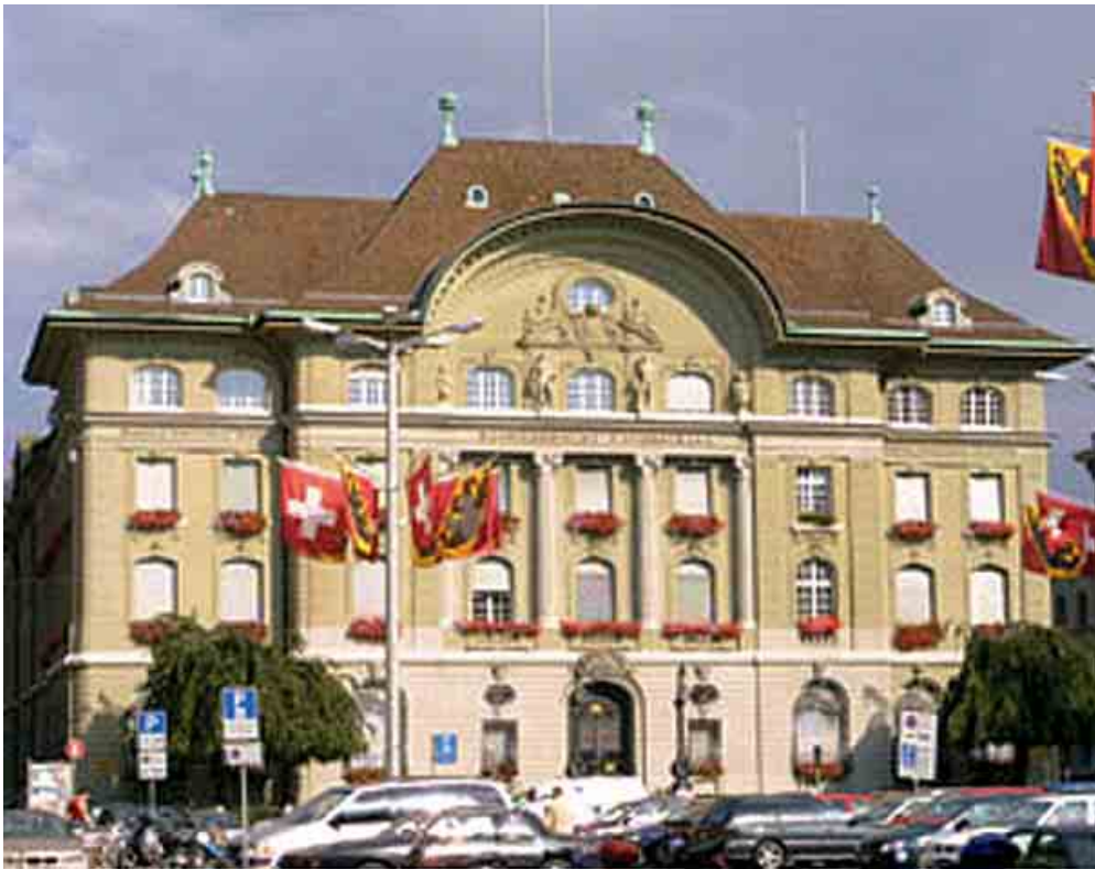
Swiss National Bank

ประเทศสวิตเซอร์แลนด์คือสวรรค์ของนักโทษทางการเมืองที่หลบหนีเข้ามา ธนาคารแห่งชาติถูกวิพากษ์วิจารณ์อย่างต่อเนื่องว่าเป็นที่อ้าเสียงทรัพย์สินหลักของพวกนาซีระหว่างสงครามโลกครั้งที่ ๒