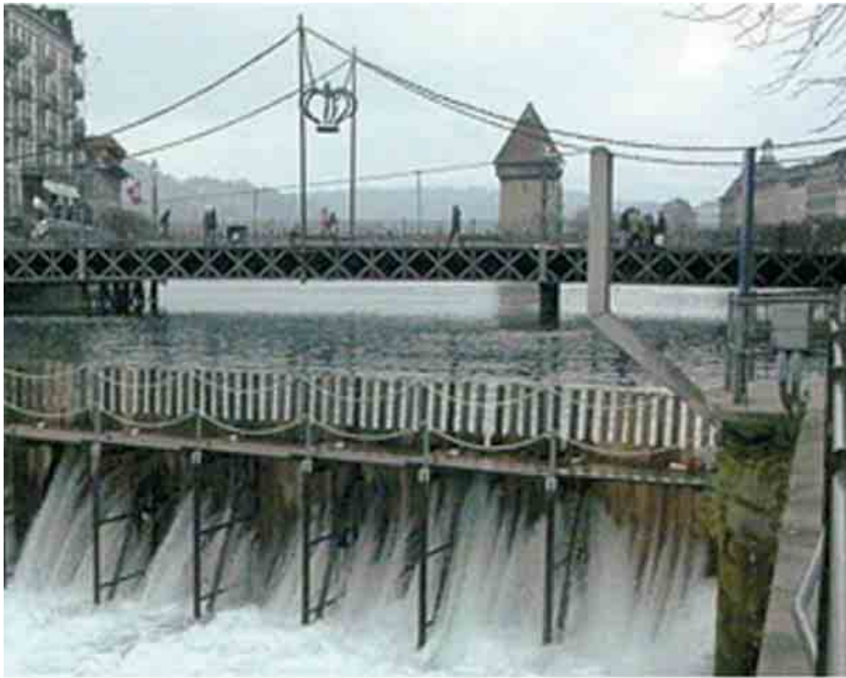
Water-Needle weir, Lucerne