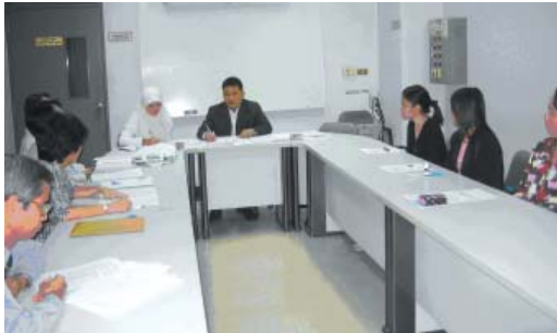
กลุ่มอาจารย์