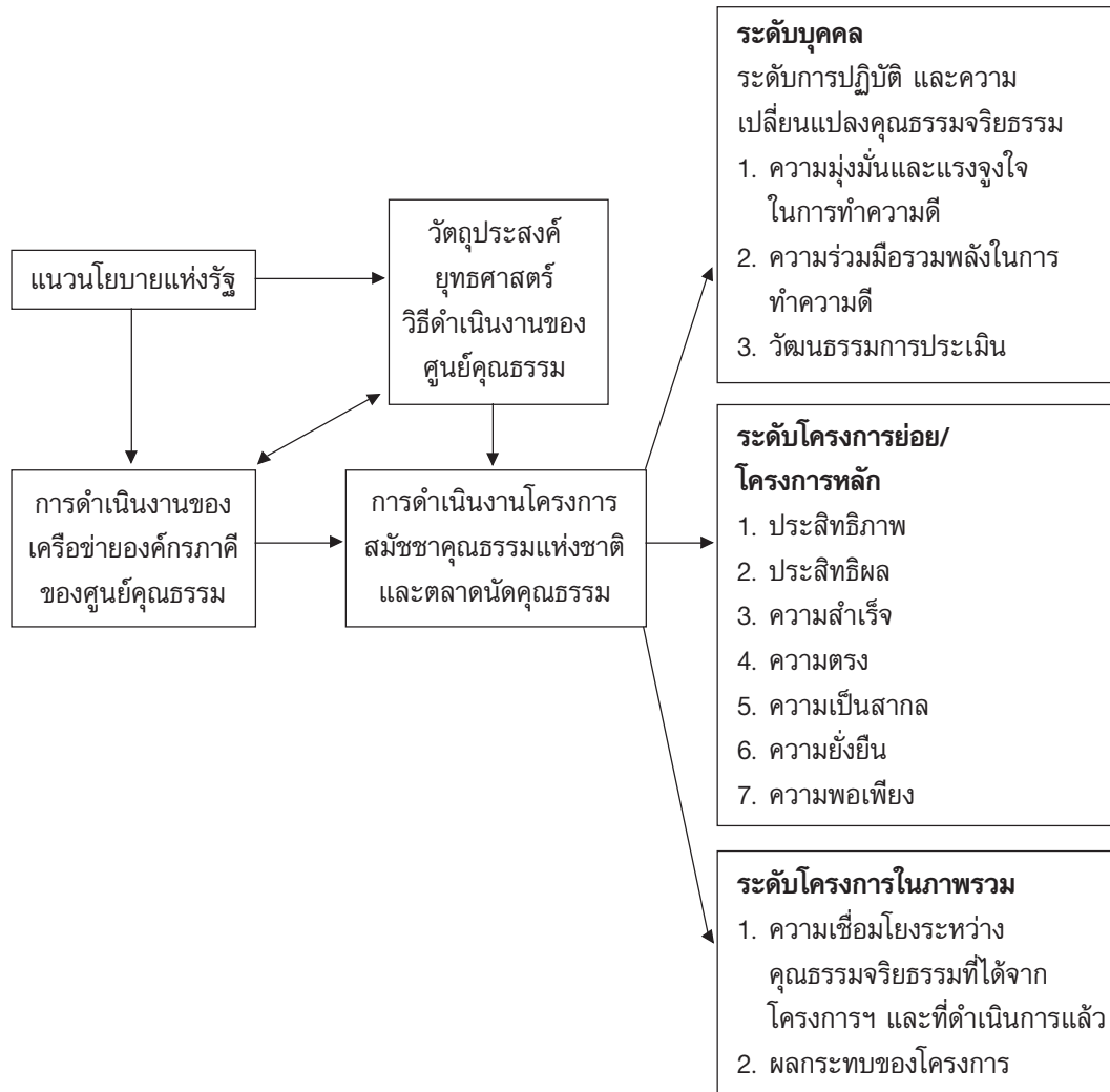
ภาพที่ 2.2 กรอบแนวคิดในการวิจัย