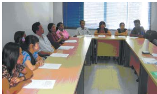
กลุ่มค้าขายและผู้ใช้แรงงาน