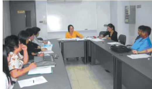
กลุ่มครู