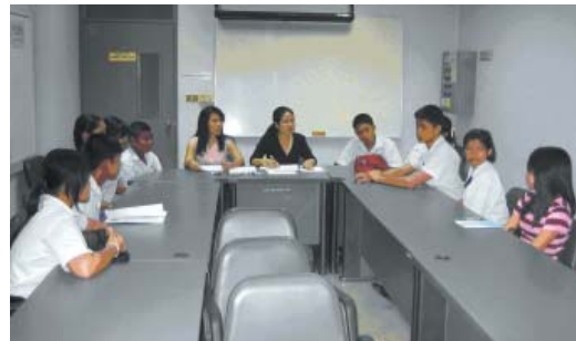
กลุ่มนักเรียน