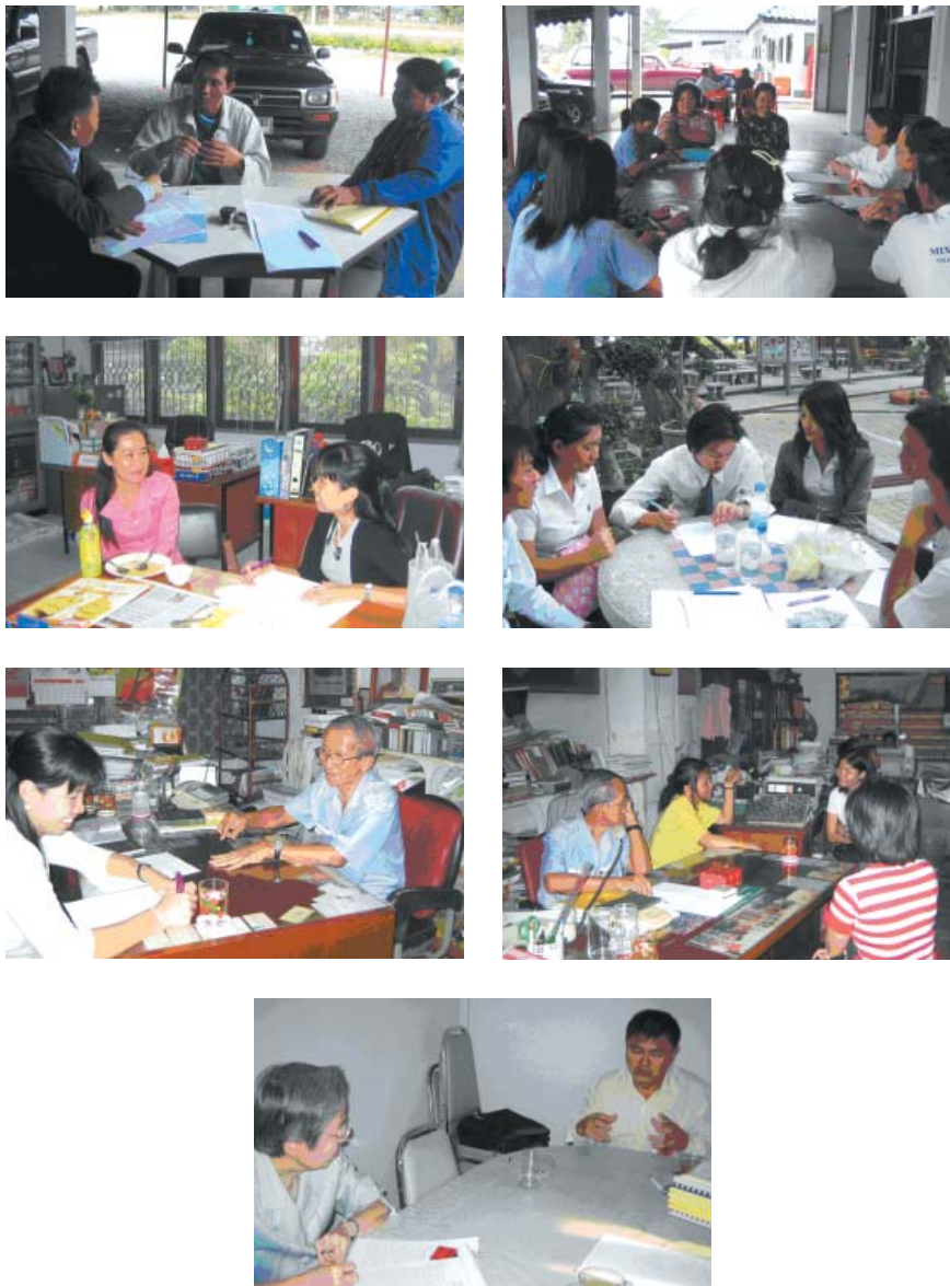
ภาพที่ 3.1 ภาพตัวอย่างการสัมภาษณ์เชิงลึกและการสัมภาษณ์แบบจัดกลุ่มสนทนา ในการประเมินแบบตรวจเยี่ยมพื้นที่

นอกจากนี้ผู้วิจัยได้รวบรวมข้อมูลจากกลุ่มผู้ที่ไม่ใช่กลุ่มเป้าหมายของโครงการฯ โดยการสัมภาษณ์แบบจัดสนทนากลุ่ม ในวันที่ 27 พฤศจิกายน 2548 จำนวน 5 กลุ่ม ณ คณะครุศาสตร์ จุฬาลงกรณ์มหาวิทยาลัย ประกอบด้วย กลุ่มอาจารย์ กลุ่มครู กลุ่มนักศึกษา กลุ่มนักเรียน และกลุ่มค้าขายและผู้ใช้แรงงาน โดยได้จัดคณะผู้ดำเนินการรวบรวมข้อมูลรวม 5 คณะ แต่ละคณะประกอบด้วย ผู้ดำเนินการสนทนา ผู้จดบันทึกและอำนวยความสะดวก บรรยากาศในการรวบรวมข้อมูลเป็นไปด้วยดีดังภาพตัวอย่างภาพที่ 3.2