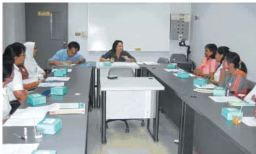
กลุ่มนักศึกษา