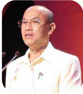
นายแพทย์เกษม วัฒนชัย องคมนตรี