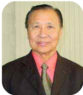
นายแพทย์กระแส ชนะวงศ์ อดีตรัฐมนตรีหลายสมัย