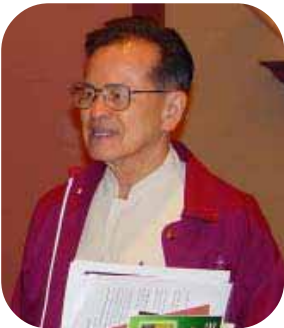
ศาสตราจารย์นายแพทย์ประเวศ วัะสี ราษฎรอาวุโส