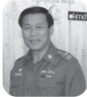
พล.ต.อ.เสรีพิศุทธิ์ เตมียะเวส รักษาการผู้บัญชาการตำรวจแห่งชาติ และรักษาการประธานกรรมการ ศูนย์ส่งเสริมและพัฒนาพลังแผ่นดินเชิงคุณธรรม