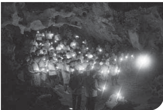
จุดประกายผู้นำแห่งอนาคต

๕.๖ กิจกรรมที่ต้องลงมือปฏิบัติ เพื่อให้เห็นคุณค่าของเกษตรกร เพื่อรู้จักการพึ่งตนเอง และการใช้ปุ๋ยชีวภาพแทนปุ๋ยเคมี คือ กิจกรรม “สร้างโลกด้วยมือเรา”