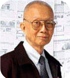
พล.ต.อ.วชิษฐ เดชกุญชร อดีตรองอธิบดีกรมตำรวจ