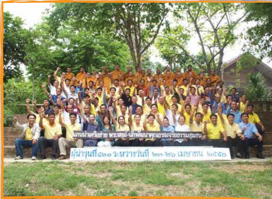
ภาพคณะครูสาย พระสอน-นิตพจนานุกรมจารย์ธรรมคุณ ผู้นำรุ่นที่ ๕๖๑ ระหว่างวันที่ ๒๓-๒๖ เมษายน ๒๕๕๖

ความจริงที่เหนือคำบรรยาย กับผลผลิตของโรงเรียนผู้นำ