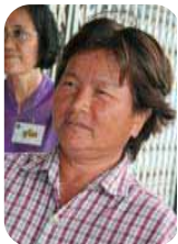
แนวร่วม 5 คร้วเรือน