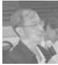
พลเอก เปรม ติณสูลานนท์