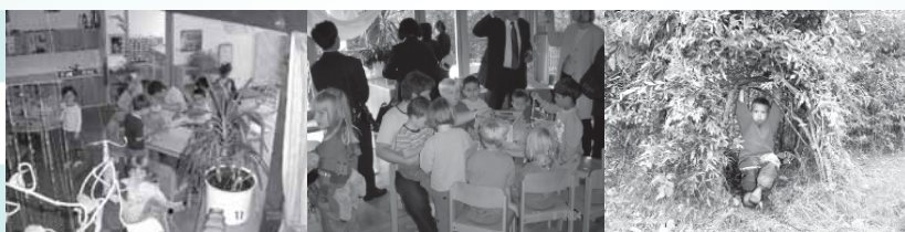
กิจกรรมใน โรงเรียนอนุบาล

เมื่อคนเยอรมันได้การอบรมสั่งสอน เล่าเรียนมาดี จึงสร้างให้คนเยอรมันรู้จักหน้าที่ของตนเอง ชัดตรงต่อหน้าที่ของตัวที่ได้รับมอบหมาย มีระเบียบวินัยในการทำงานและในการดำรงชีวิตประจำวัน มีความสะอาดในทุกสถานที่ เช่นทั้งที่บ้านและที่ทำงาน รวมถึงที่สาธารณะ และยานพาหนะ มีความตรงต่อเวลา สม่่าเสมอ มีมารยาท มีความรับผิดชอบต่อหน้าที่ในบ้านและที่ทำงาน มีความซื่อสัตย์สุจริตไม่คดโกง มีความประหยัดมัธยัสถ์ มีความ