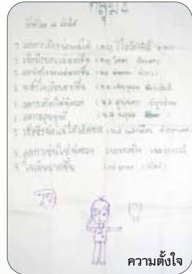
ความตั้งใจ

“กลุ่มทุกกลุ่มมันจะอยู่ได้อยู่แล้ว แต่การต่อยอดของแต่ละกลุ่มมันจะ