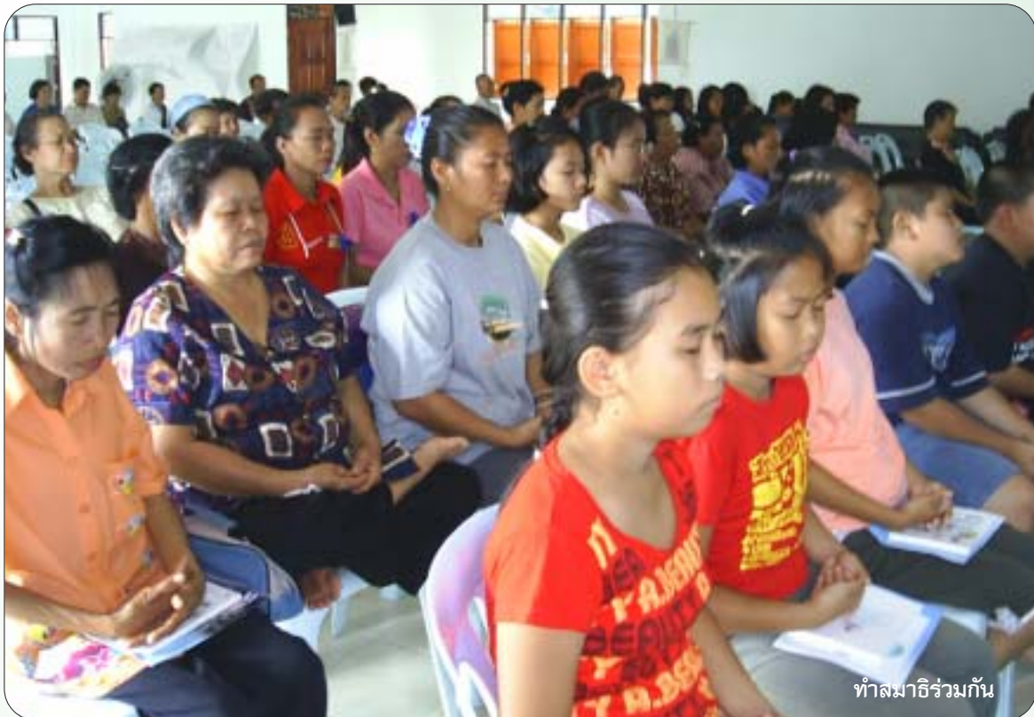
ทำสมาธิร่วมกัน

ปัญหานั้นด้วยตัวเอง ตั้งสัจจะร่วมกันที่จะสะสมทรัพย์ไว้เป็นทุนของหมู่บ้าน และมองตัวเงินที่สะสมไว้อย่างมีสติ มีความยับยั้งชั่งใจ ใช้เงินทุนจำนวนนี้พัฒนาคุณธรรมให้แก่คนตั้งแต่เกิดจน