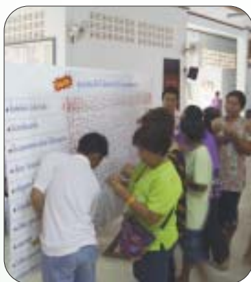
ร่วมไหวตคุณธรรมนำสุข