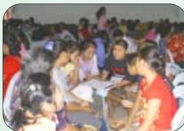
แลกเปลี่ยนเรียนรู้