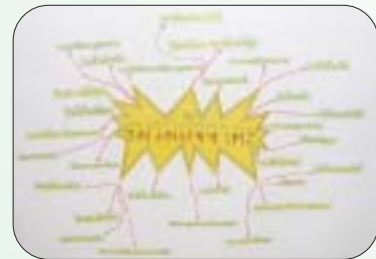
ตัวอย่างการขยายผล