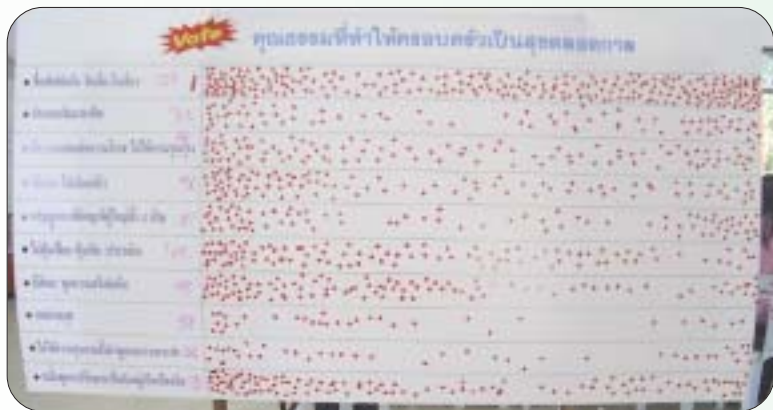
ผลไหวตคุณธรรมนำสุข