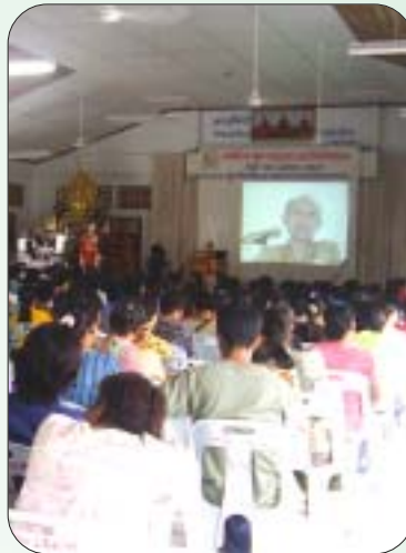
อาจารย์ไพบูลย์บรรยายพิเศษ

และในตอนท้ายของการเข้าค่าย ก็จัดให้มีพิธีทอดผ้าป่าคุณธรรม โดย เขียนสิ่งที่จะเลิกและสิ่งที่จะทำต่อไป