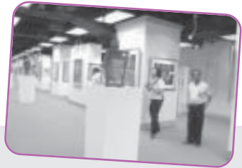
งานเดี่ยวได้เสพทั้งงานศิลปะ และงานธรรมะ

คณะผู้จัดงานแจ้งว่า นิทรรศการชุดนี้จะเปิดแสดง