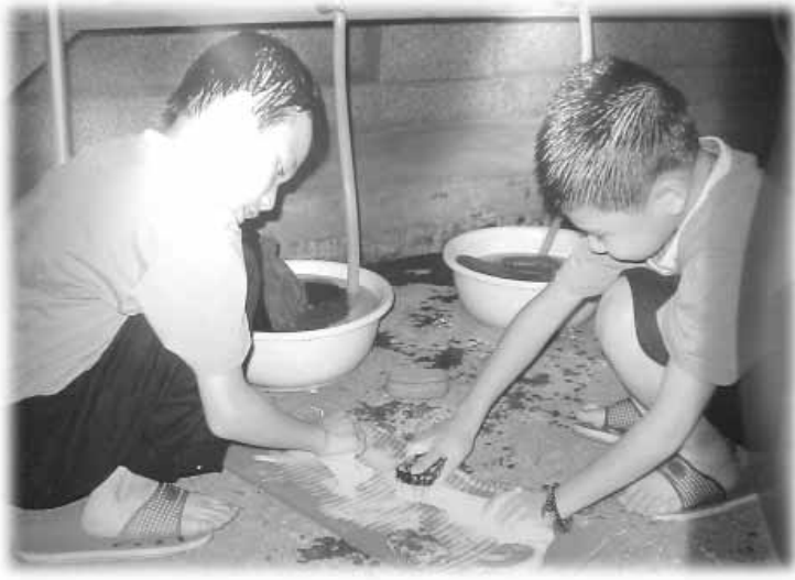
นักเรียนตัวน้อยๆ ได้รับการฝึกนิสัยให้เป็นผู้ใฝ่ทำงานทุกประเภท

นักเรียนคนไหนเรียนดี มีนิสัยดีจะได้รับมอบหน้าที่ตักอาหารบริการครู นักเรียนที่ได้รับหน้าที่นี้จะตั้งใจมาก เวล่านักเรียนนำอาหารไปบริการครูครูจะยกมือไหว้ขอบคุณ นอกจากนี้ยังได้มีโอกาสล้างส้อม ใครที่ได้รับหน้าที่ล้างส้อมจะตั้งใจมากเพราะถือว่าจะต้องทำดีจึงจะได้รับมอบหน้าที่นี้ การฝึกอบรมเช่นนี้มีผลทำให้เด็กนักเรียนไม่รังเกียจงานใช้แรงงาน ไม่รังเกียจการทำงานสกปรก ไม่มองว่าเป็นงานต่ำต้อยซึ่งตรงข้ามกับการสร้างทัศนคติในบ้านเมืองเรา