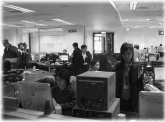
บรรยากาศส่วนหนึ่งของ สถานีโทรทัศน์ต้าอ้าย