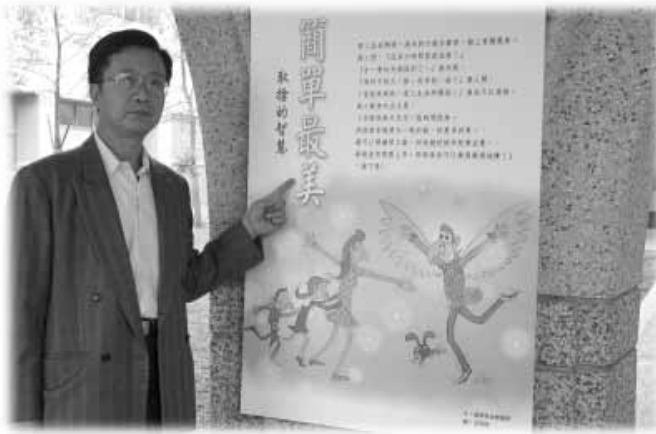
ภาพวาดประกอบ โคลงติดแสดงไว้ ให้เด็กอนุบาล เลือกเรียนรู้ได้ตาม อัธยาศัย

โต๊ะอ่านหนังสือในห้อง สมุดโรงเรียนอนุบาล พุทธฉือจี้ (มีแจกันดอกไม้ ทุกโต๊ะจัดโดยฝีมือ นักเรียน)