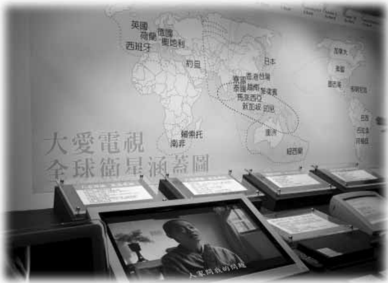
สถานีโทรทัศน์ด้าอ้าย เผยแพร่สัญญาณภาพไปทั่วโลก

เฉพาะสถานีโทรทัศน์ที่เผยแพร่เชิงศาสนา ก็มีมากถึง 6 ช่อง