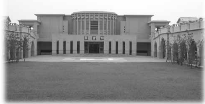
มุมหนึ่งในโรงเรียนอนุบาลพุทธจีที่ฮวาเหลียน

บริเวณโรงเรียนอนุบาลที่ไปดูงาน จัดสถานที่สวยงาม สะอาด เป็นระเบียบมาก นักเรียนมีระเบียบวินัยดีมาก เวลาถอยรถงเท้าเข้าห้อง ทุกคนจะจัดเรียงรองเท้าอย่างเป็นระเบียบหันหัวรองเท้าออกแบบสไตส์ญี่ปุ่น ทุกตึกจะมีห้องเอนกประสงค์ให้นักเรียนได้ทำกิจกรรม มีห้องเรียน ห้องสมุด ห้องปฏิบัติธรรม ห้องเรียนจัดดอกไม้ ห้องเรียนการชงชา มีสวนครัว สวนเกษตร มีพื้นที่สำหรับฝึกฝนกีฬาทั้งในร่มและกลางแจ้ง มีหอพัก ฯลฯ เรียกว่าในเชิงสถานที่และอุปกรณ์มีอย่างครบครัน เด็ก ป.1 ได้เริ่มเรียนภาษาอังกฤษแล้ว พอถึง ป.3 ได้เรียนภาษาอังกฤษ 4 ชั่วโมงต่อสัปดาห์