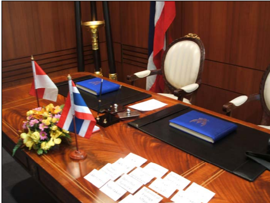
อีกมุมหนึ่งในห้องบัวแก้วสำหรับให้แขกชาวต่างประเทศลงนามในสมุดเยี่ยม