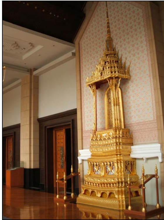
บุษบกสีทองซึ่งเป็นการจำลองรูปบัญชา (หน้าต่าง) ที่พระเจ้าแผ่นดินของไทยในสมัยกรุงศรีอยุธยา ใช้ในการออกมารับแขกเมืองจากต่างประเทศ