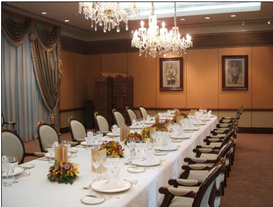
ห้องสัตตบงกช ใช้ในการเลี้ยงรับรองแขกเมืองระดับสูง