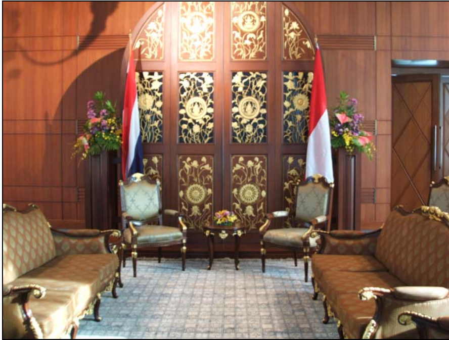
ห้องบัวแก้ว สำหรับการหารือข้อราชการในระดับสูงกับแขกชาวต่างประเทศ