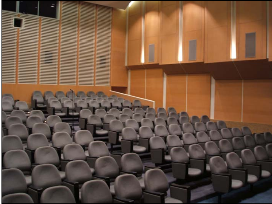
ห้องนราธิป ห้องประชุมแนวลาด ตั้งชื่อเพื่อรำลึกถึงพลตรีพระเจ้าวรวงศ์เธอ กรมหมื่นนราธิปพงศ์ประพันธ์ รัฐมนตรีว่าการกระทรวงการต่างประเทศ ระหว่างปี พ.ศ. 2495-2501 โดยทรงเป็นคนไทยคนแรกที่ได้รับเลือกตั้งให้ดำรงตำแหน่ง ประธานสภามหาวิทยาลัยราชภัฏศรีนครินทร์ระหว่างปี พ.ศ. 2499-2500 ปัจจุบัน ห้องนี้ใช้สำหรับการบรรยายแก่คณะทูตานุทูตต่างประเทศ