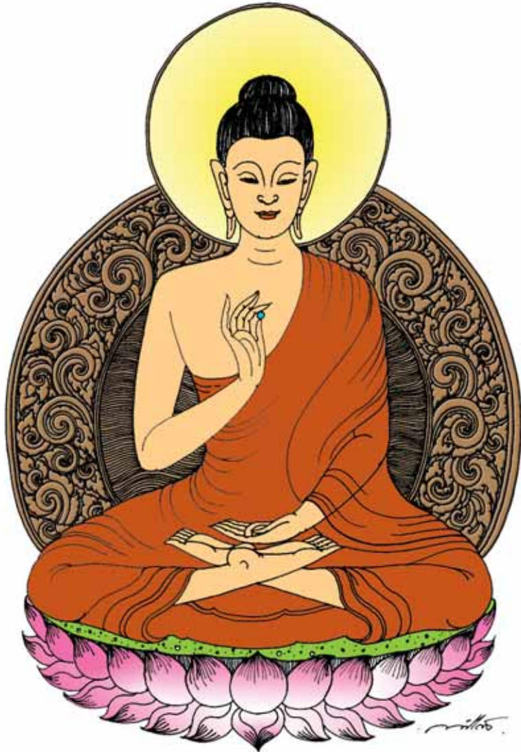
พระศรีอริยเมตไตรย มหาโพธิสัตว์