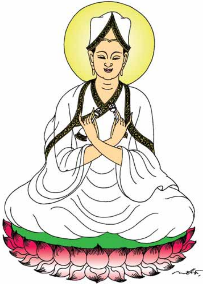
นอน นอน ฝัน ฝันไป