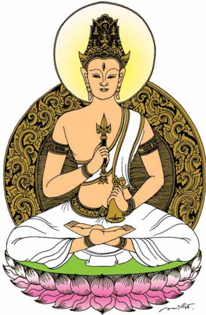
พระศรีปทุมมา มหาโพธิสัตว์