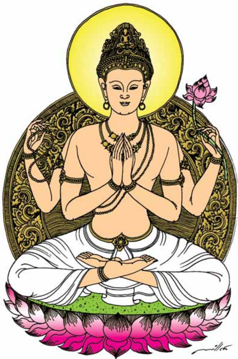
พระอวโลกิเตศวร มหาโพธิสัตว์