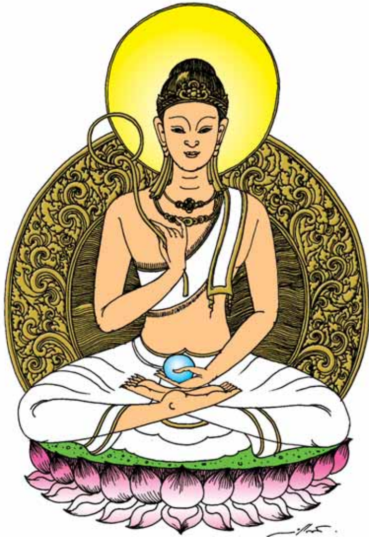
พระอรหันต์ มหาโพธิสัตว์