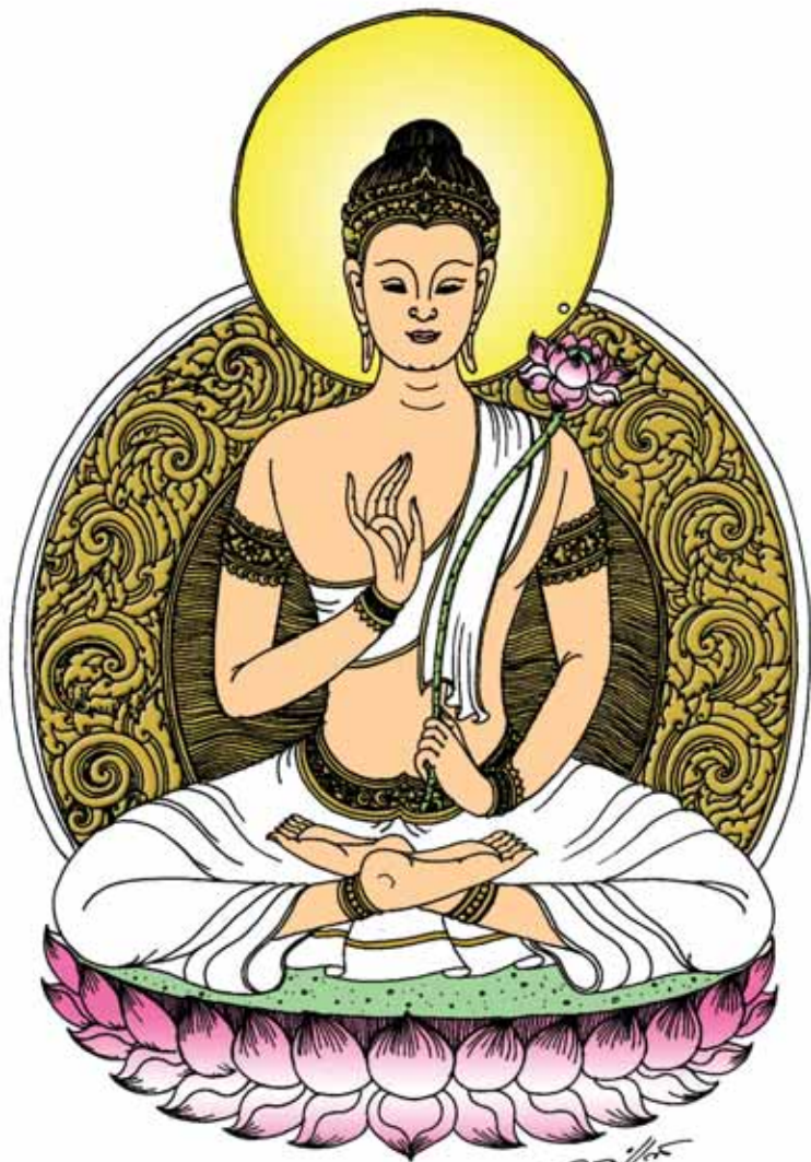
พระสมันตภัทร มหาโณศีล