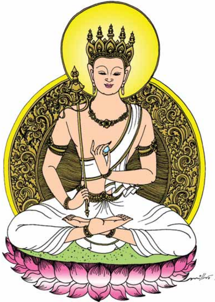
พระวิษณุกรรม มหาโพธิสัตว์