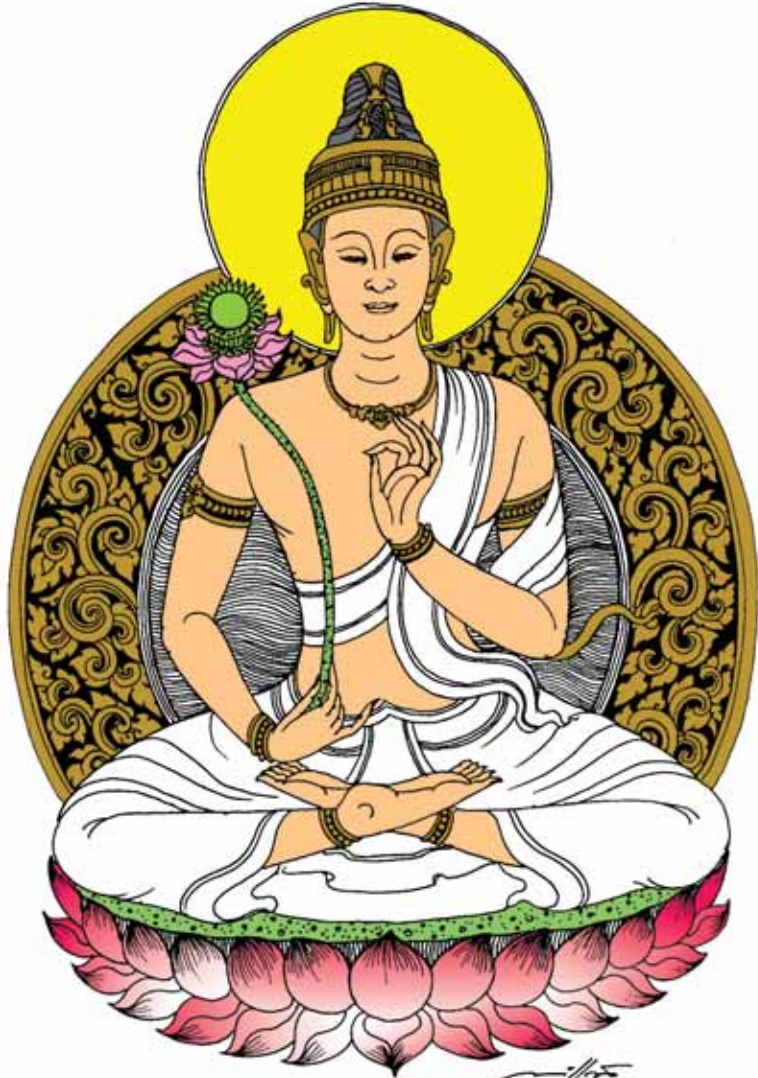
พระยาศาสน์ธรรม มหาโพธิ์สัตว์