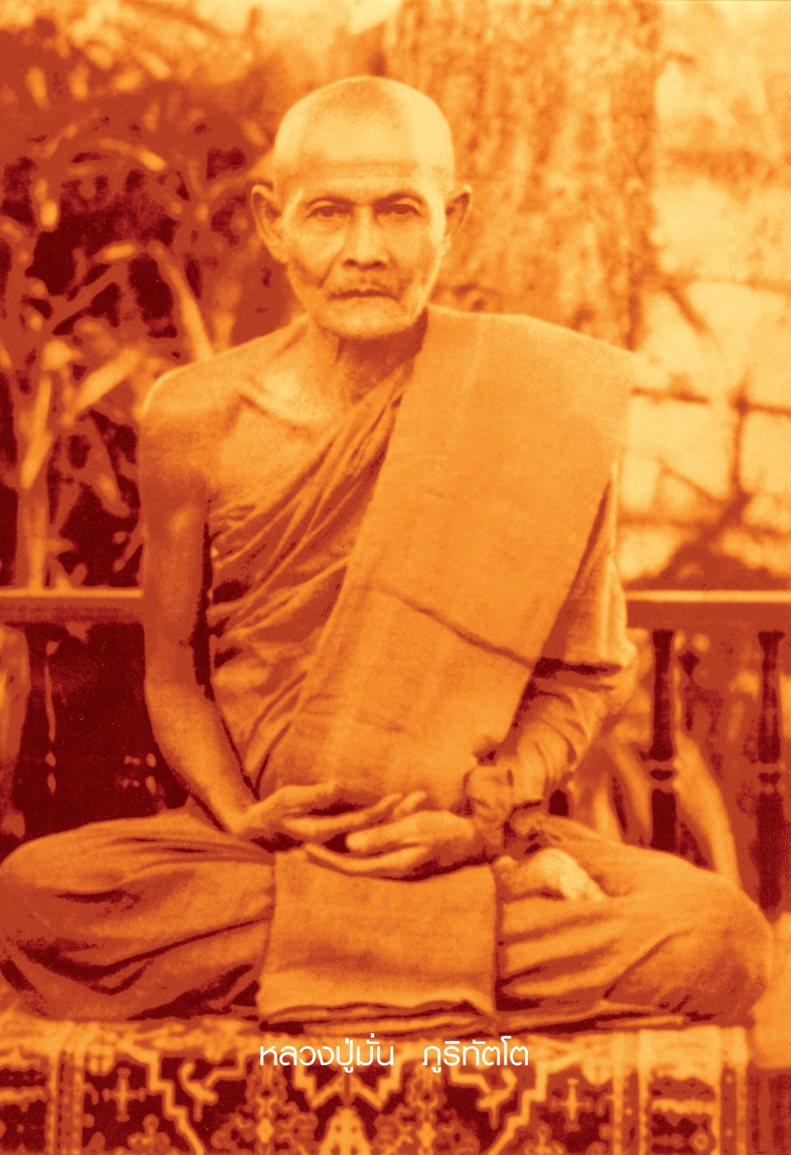
หลวงปู่มั่น ภูริทัตโต