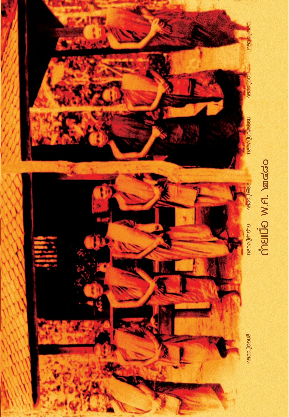
កសិករស្រូវ