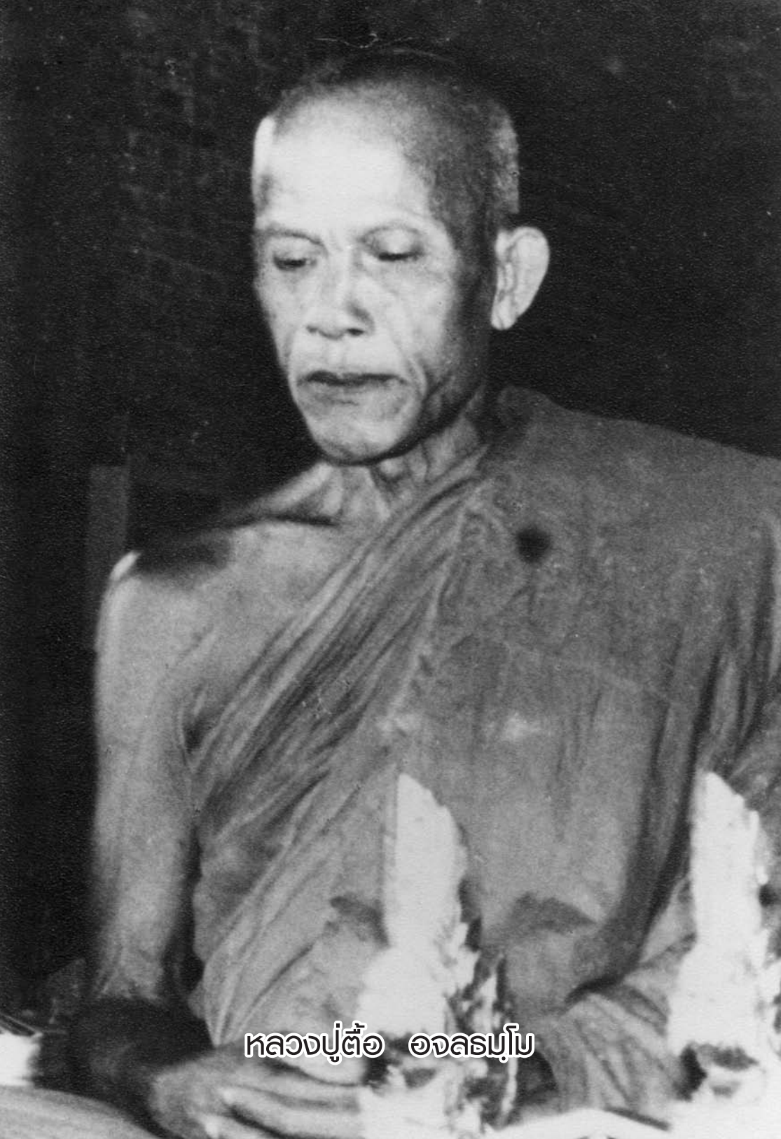
หลวงปู่ต๋อ อจลนุโ