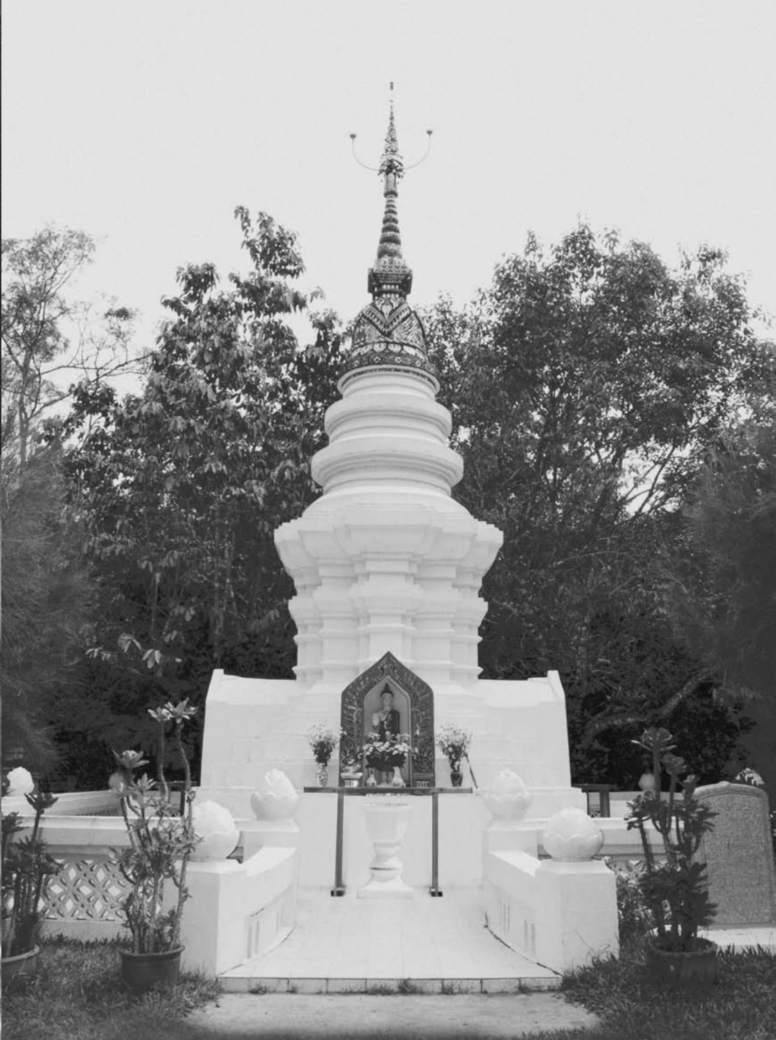
พระเจดีย์ วัดอรุณญวิเวก บ้านโป่ง