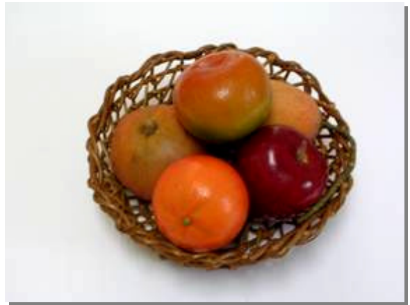
ผลิตภัณฑ์เถาวัลย์แดงในรูปแบบต่าง ๆ