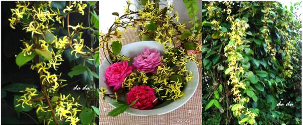
ลักษณะทั่วไปของต้นเถาว์ลัยแดง

ผลิตภัณฑ์จากเถาว์ลัยแดง เป็นศิลปหัตถกรรมที่มีต้นทุนค่อนข้างต่ำ เนื่องจากมีวัตถุดิบที่หาได้ง่าย ราคาถูก วัสดุอุปกรณ์สำหรับการผลิตเป็นวัสดุอุปกรณ์พื้นฐานที่มีอยู่แล้ว หรือสามารถหามาประยุกต์ใช้ได้โดยง่าย กรรมวิธีในการผลิตมีกระบวนการที่ไม่ยุ่งยากซับซ้อน สามารถใช้แรงงานในครัวเรือนผลิตในยามว่าง หลังจากว่างเว้นจากการประกอบอาชีพการเกษตร ซึ่งนับว่าเป็นการ “เพิ่มรายได้ ลดรายจ่าย ขยายโอกาส” โดยใช้ภูมิปัญญาและทรัพยากรธรรมชาติในท้องถิ่นมาใช้ให้เกิดประโยชน์อย่างยั่งยืนอย่างแท้จริง