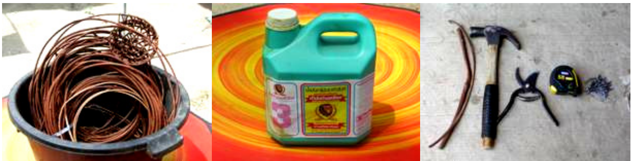
เครื่องมือและอุปกรณ์ที่ใช้ในการจัดทำผลิตภัณฑ์