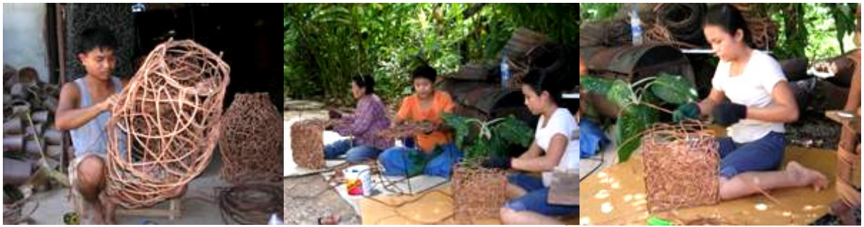
วิธีการผลิต