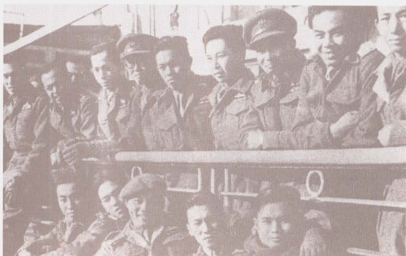
กองกำลัง ๑๓๖ สังกัดกองทัพอังกฤษ - เสรีไทย