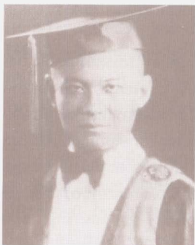
อาจารย์ป่วยในชุดครุยมหาวิทยาลัย ธรรมศาสตร์ พ.ศ. ๒๔๘๓