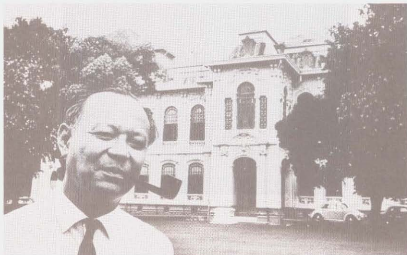
อาจารย์ปวยหน้าตาหนัก่วงบางขุนพรหม ธนาคารแห่งประเทศไทย