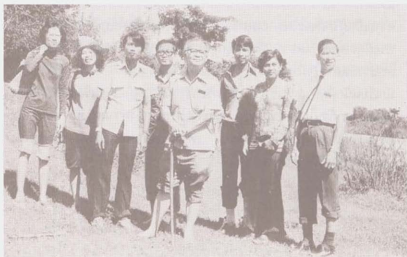
อาจารย์ปวยไปเยี่ยมบัณฑิตอาสาสมัคร พ.ศ. ๒๕๑๖