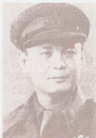
อาจารย์ป่วยในเครื่องแบบยศพันตรี แห่งกองทัพอังกฤษ