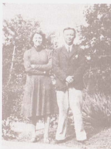
ถ่ายคู่กับภรรยา