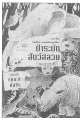
หน้า 192 หน้า ราคา 120 บาท

ล่วงถึงยุคสมัยที่ความชอบธรรมในทางเศรษฐกิจและการเมือง หาใช่ปัญหาที่ปัจเจกชนจะสามารถแสดงบทบาทได้อย่างสมศักดิ์ภาพได้อีกต่อไป ณ ต้นศตวรรษที่สามแห่งกรุงรัตนโกสินทร์ “คมทวน คันธนู” จึงค่อยรามือจากปัญหาที่เผชิญหน้ากับคณะรัฐประหารปีศาจกลุ่มหลายสมัย โดยแทบจะหาประโยชน์โภคผลได้น้อยเต็มทน แล้วหัน “คมทวน” มาสู่เรื่องราวที่ดูเข้มข้นน้อยกว่า หากแนบแน่นมาช้านานกว่าสองเรื่อง คือ “ธรรมชาติ” และ “วรรณคดี”