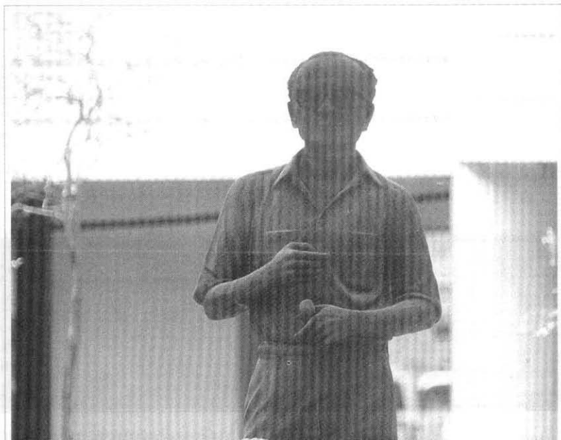
รูปปั้นอาจารย์ป๋วยที่มหาวิทยาลัยธรรมศาสตร์ รัชสิด ปั้นโดย มิเชียม อิบอินซอย