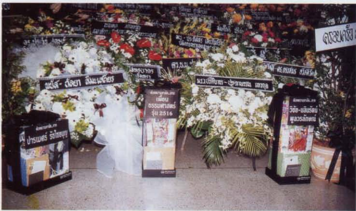
ส่วนหนึ่งของหรีดที่ส่งมาเคารพศพ