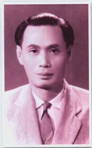
วัยทำงาน