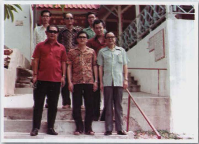
กับเพื่อน ๆ ชมรมผู้จัดการธนาคารสาขา