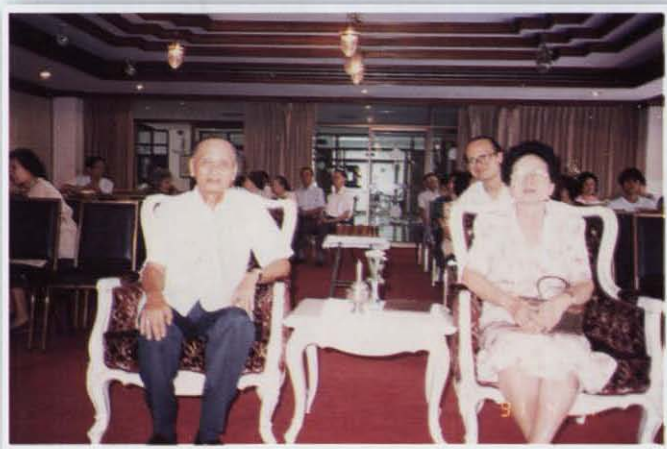
ทำบุญวันเกิดครบ ๖ รอบ พ.ศ. ๒๕๓๔