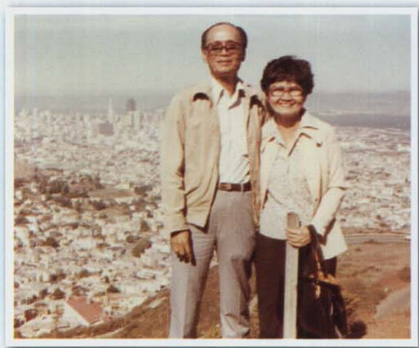
ท่องเที่ยวต่างประเทศ