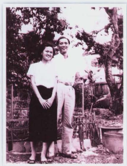
กับคุณแม่สมัยแต่งงานใหม่ ๆ