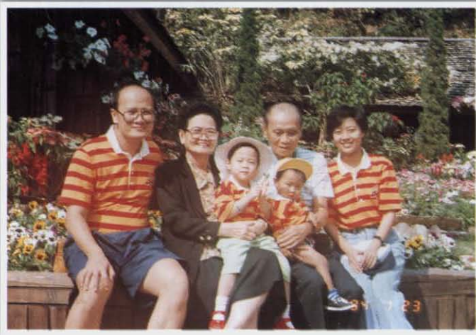
เที่ยวเชียงใหม่กับหลานปู่