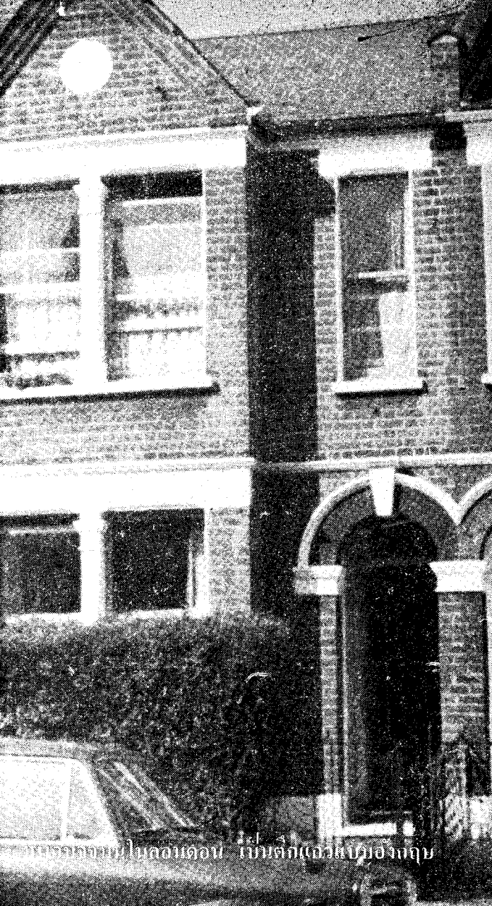
อพยพจากชนบทในลอนดอน เป็นตึกแถวแบบอังกฤษ