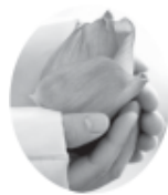
ถึงไต่ต่อบันในชาตินี้

พร้อมด้วยการประพฤติธรรมสมควรแก่ธรรม หรือพร้อมด้วยการใช้จิตที่ตั้งมั่นจวนแน่นแน่ว พิจารณาสິงที่เข้าสัมผัสจิตโดยแยบคาย ก็ สามารถบรรลุวิริยธรรมในพุทธศาสนาได้ คนในครั้งโบราณจึงไม่จำเป็นต้องมานั่งฝึกจิต ให้สงบตั้งมั่นเป็นสมาธิ แล้วฝึกจิตให้เกิด ปัญญาเห็นแจ้งอย่างที่เราใช้ฝึกกัน จนเจ็บแสบ เจ็บขาเป็นทุกขเวทนาดังปรากฏให้เห็นอยู่ใน ปัจจุบัน เหตุเป็นเพราะคนที่มาเกิดอยู่ในครั้ง ปัจจุบัน มีบุญบารมีสั่งสมมาแต่อดีตชาติไม่ มากพอ จึงต้องมาบำเพ็ญต่อในชาติปัจจุบัน จึงทำให้โอกาสบรรลุธรรมเนิ่นช้าออกไป