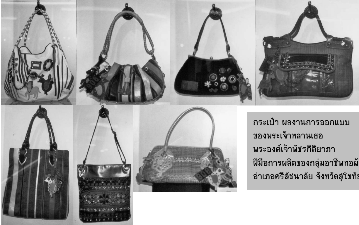
กระเป๋า ผลงานการออกแบบ ของพระเจ้าหลานเธอ พระองค์เจ้าพัชรกิติยาภา ฝีมือการผลิตของกลุ่มอาชีพทอผ้า อำเภอศรีสังขาลย์ จังหวัดสุโขทัย